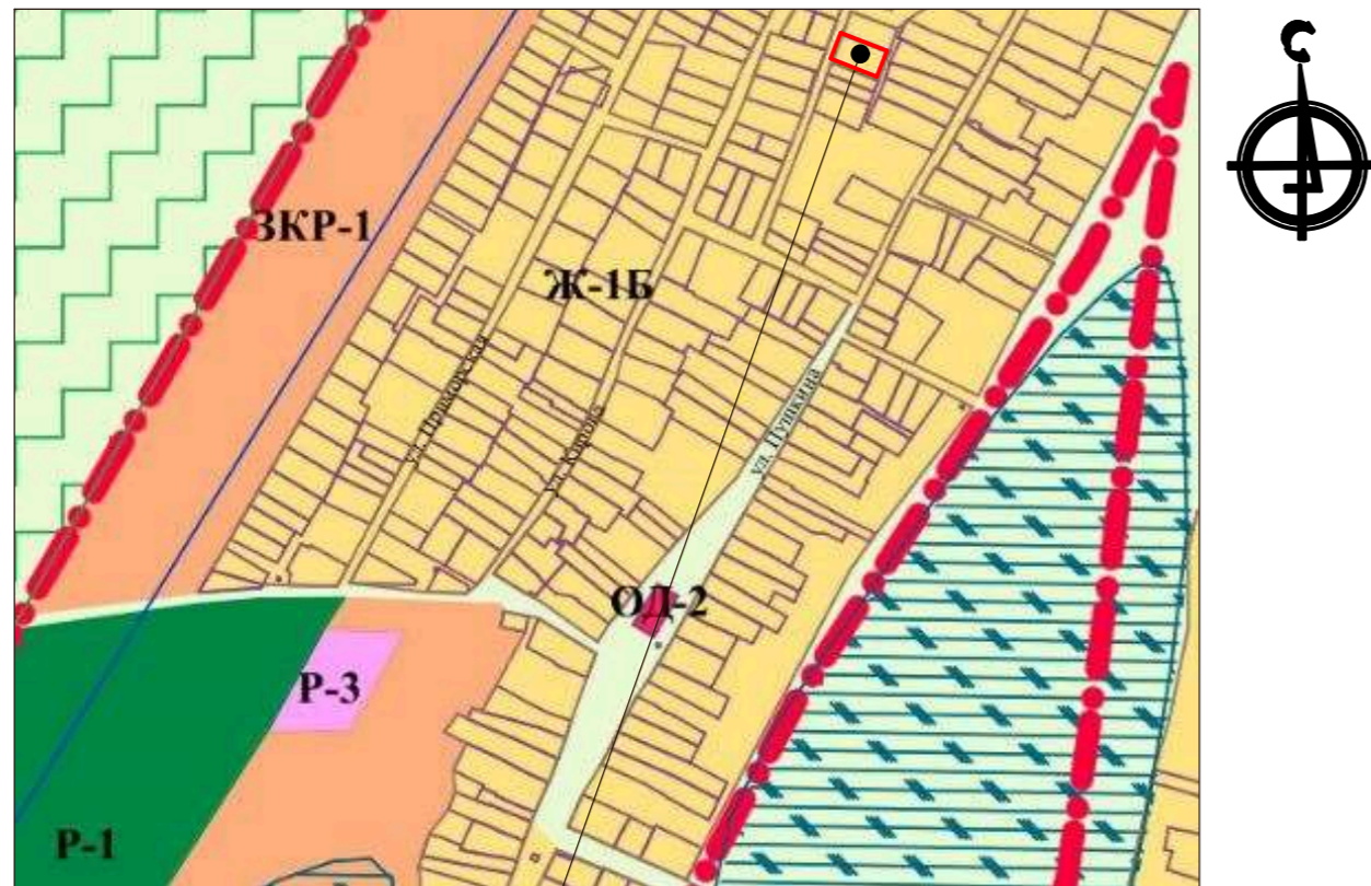
План земельного участка М1:1000

Рассматриваемый земельный участок 23:08:0102027:4