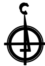
Рассматриваемый земельный участок 23:08:0102091:19