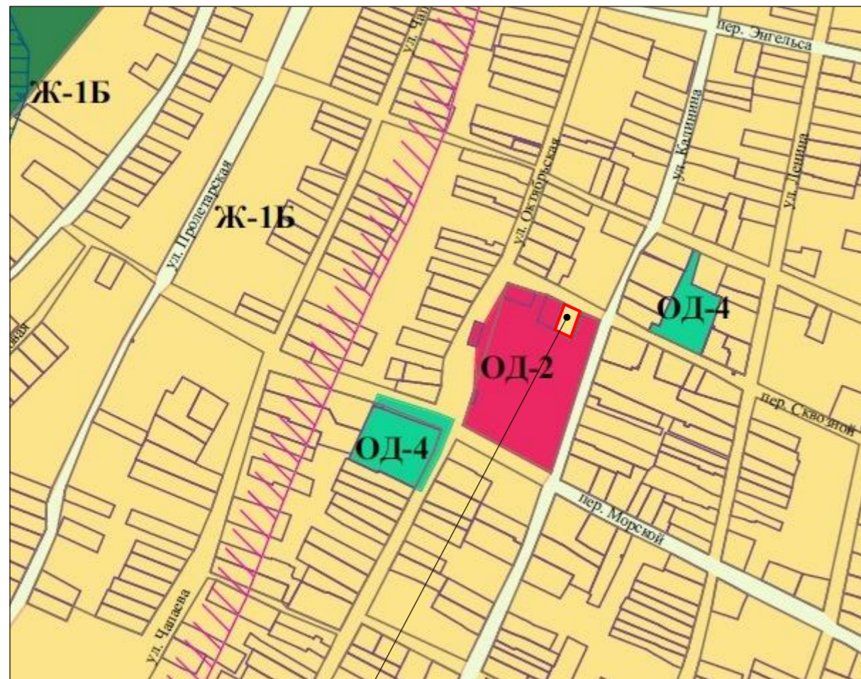
Схема градостроительного зонирования с картой зон с особыми условиями использования территории М1:2000