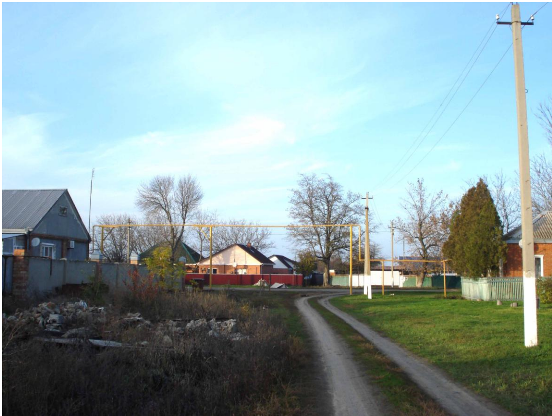
Рис. 11. Ул. Зеленая. Рядом с акацией (в центре снимка) был дом Е. Ф. Северинова