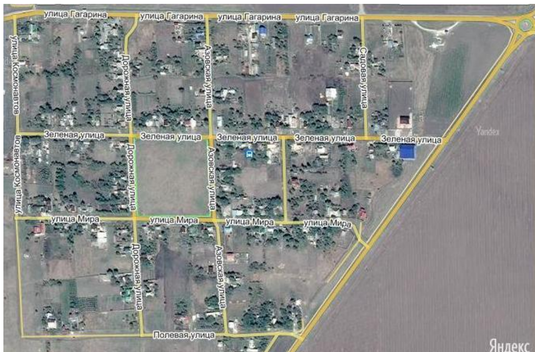
Рис. 14. Схема хутора Приазовка