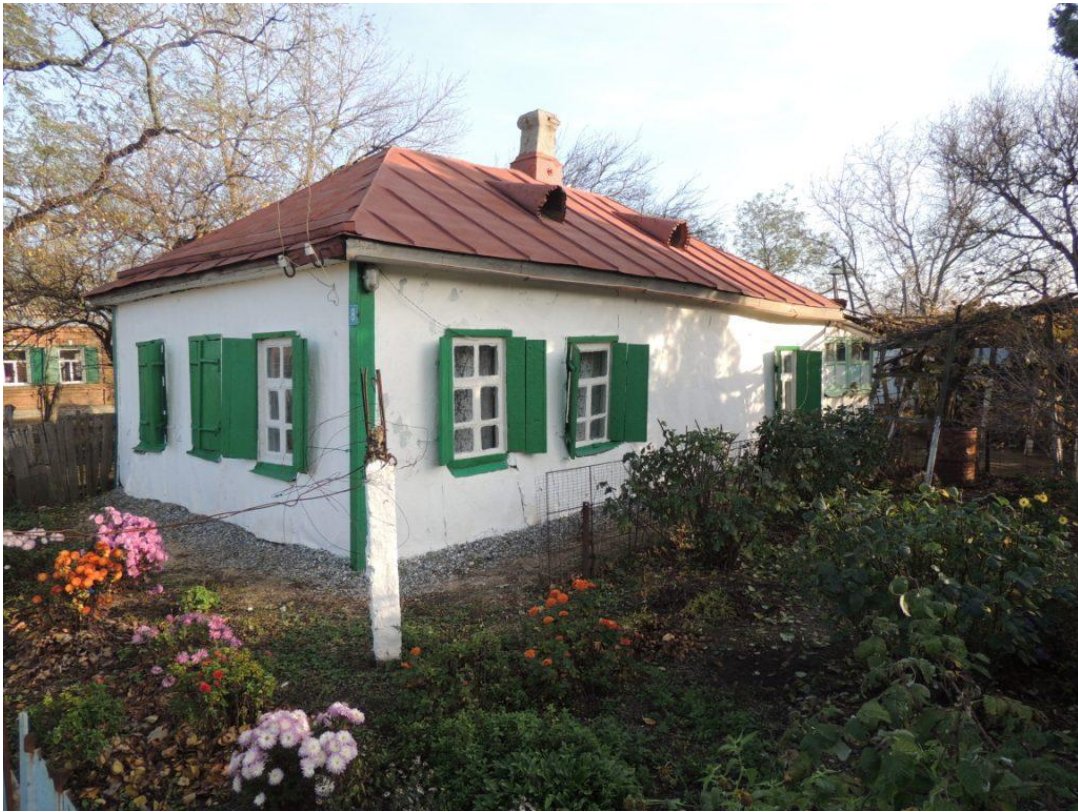
Рис. 9. Дом по ул. Мира, который принадлежал семье казаков Мазур