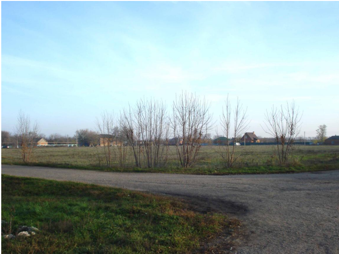
Рис. 13. Пересечение улиц Дорожной и Зеленой. Вид на хуторскую площадь (майдан)