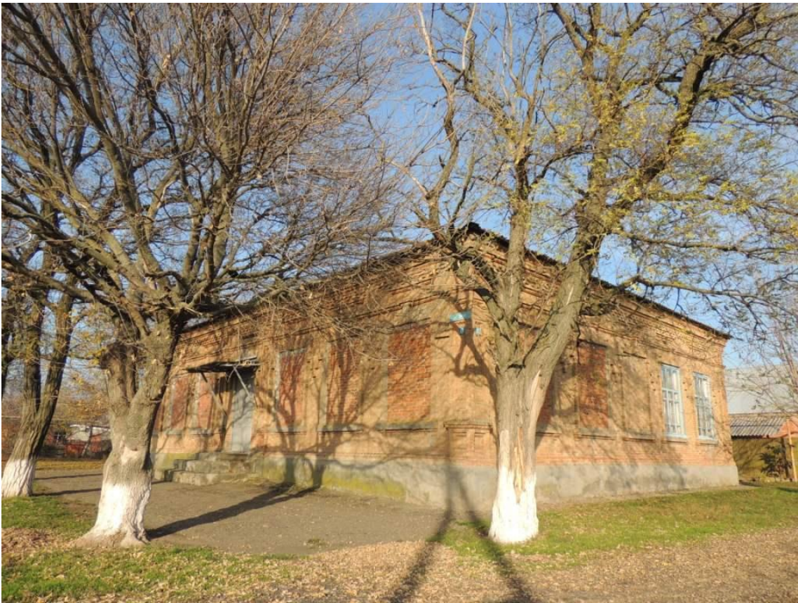
Рис. 10. Здание сельского клуба хутора Призовка