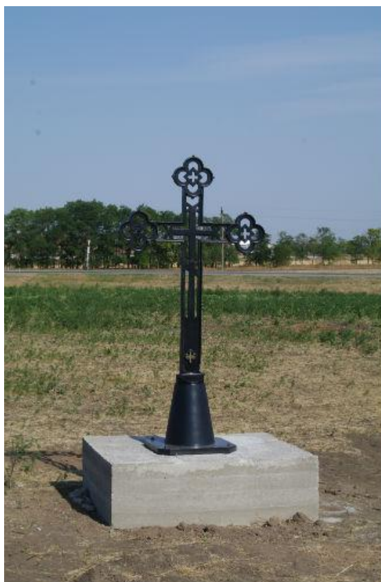
Рис. 7. Поклонный крест у хутора Приазовка, установлен в августе 2012 г.