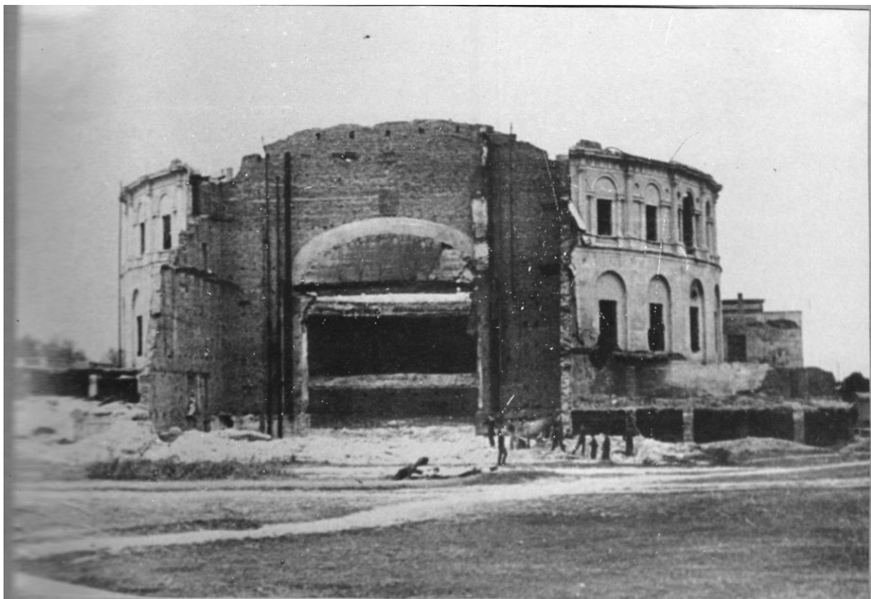
Рис.5. ДКААФ в начале 50-х гг. XX в.