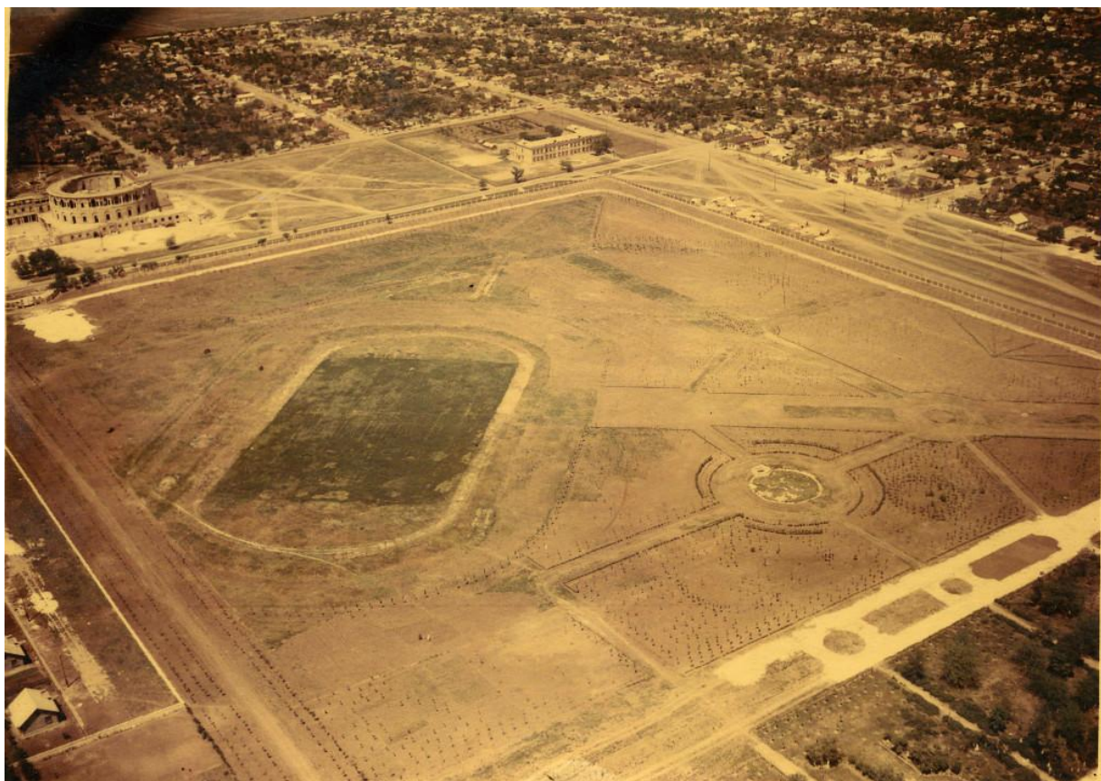
Рис.7. Вид с самолета на парк им. И.М. Поддубного. Вдоль ул. Первомайской виднеется разрушенный Дом Красной Армии, Авиации и Флота (слева) и здание школы № 4 (вверху в центре). Начало 50-х гг. XX в.