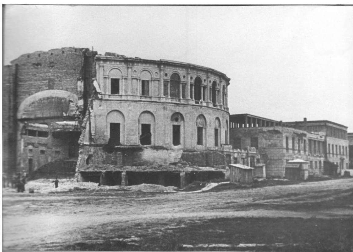
Рис.6. ДКААФ в начале 50-х гг. XX в.