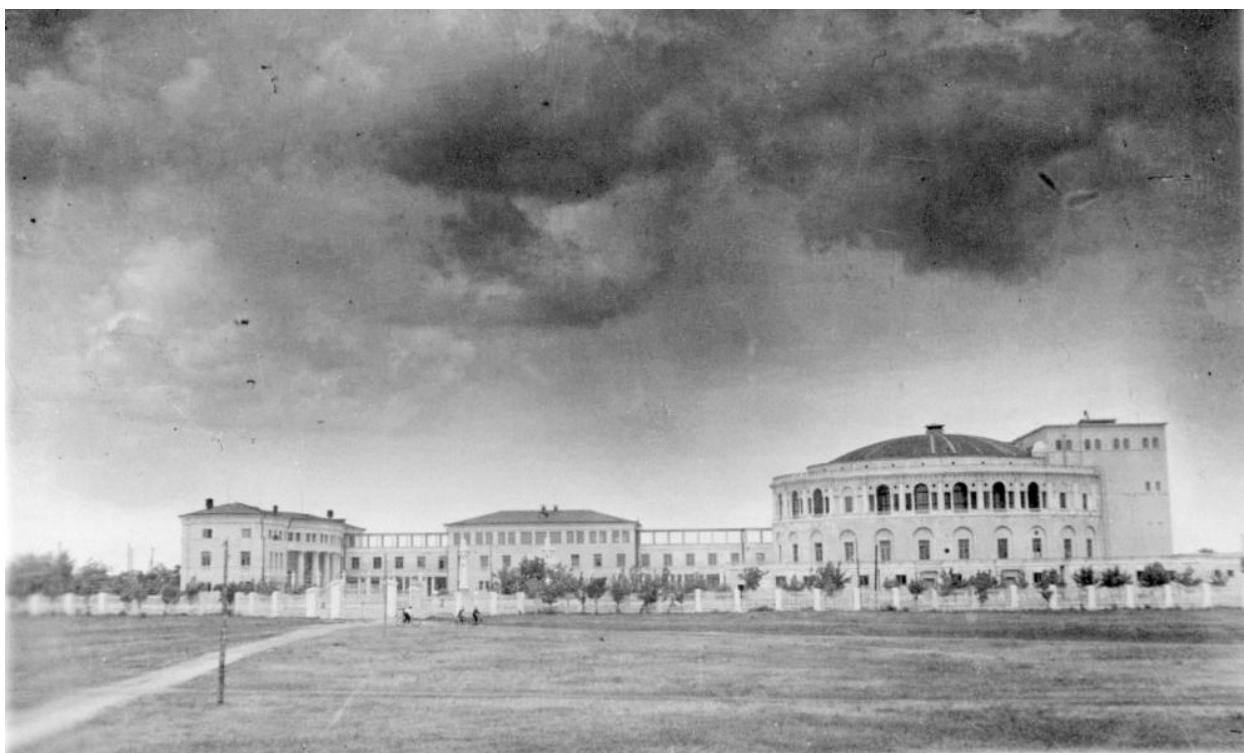
Рис.2. ДКААФ в начале в начале 40-х гг. XX в.