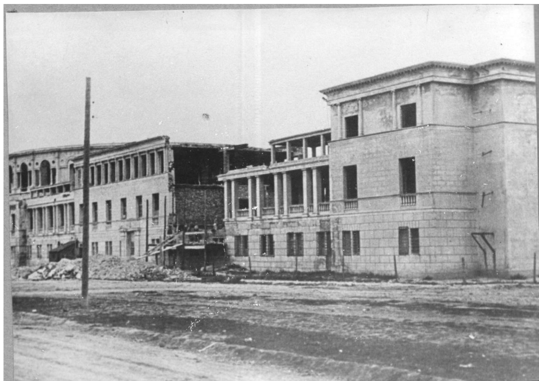
Рис.4. ДКААФ в начале 50-х гг. XX в.