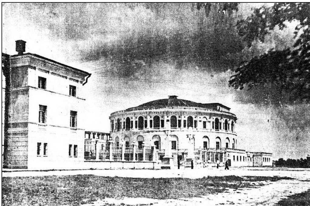
Рис.1 ДКААФ в начале 40-х гг. XX в.