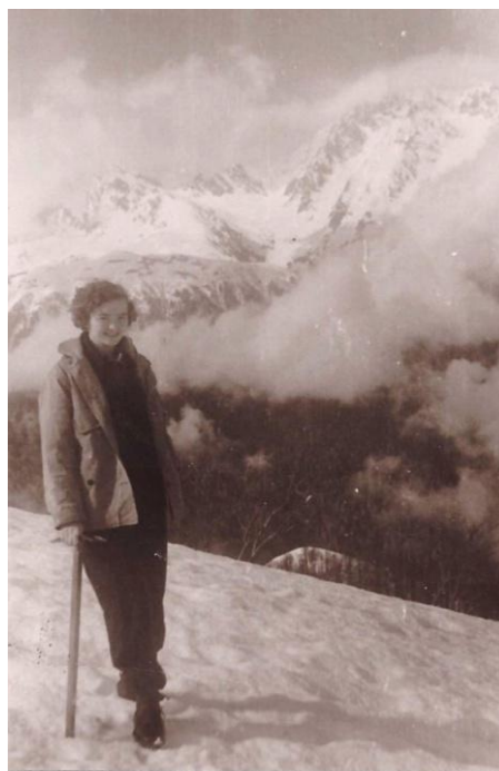
В горах Кавказа с ледорубом. 1956 г.