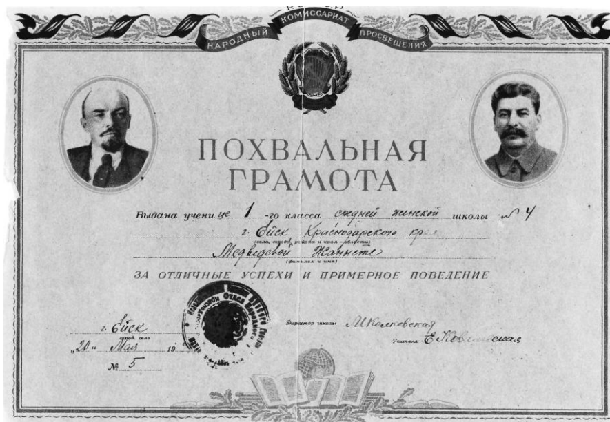
Грамота за 1 класс