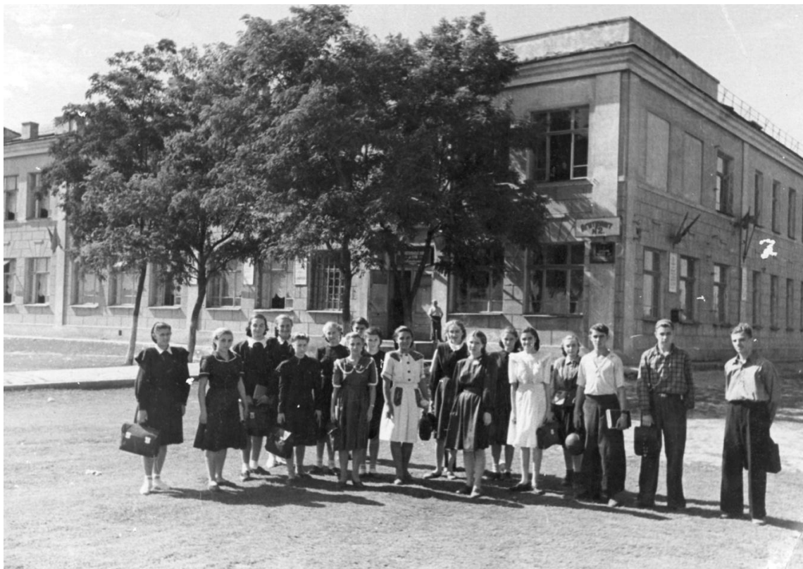
СОШ № 4, ныне лицей № 4 им. профессора Е.А. Котенко, ул. П. Майская, д. 196, Ейск. 1952 г.