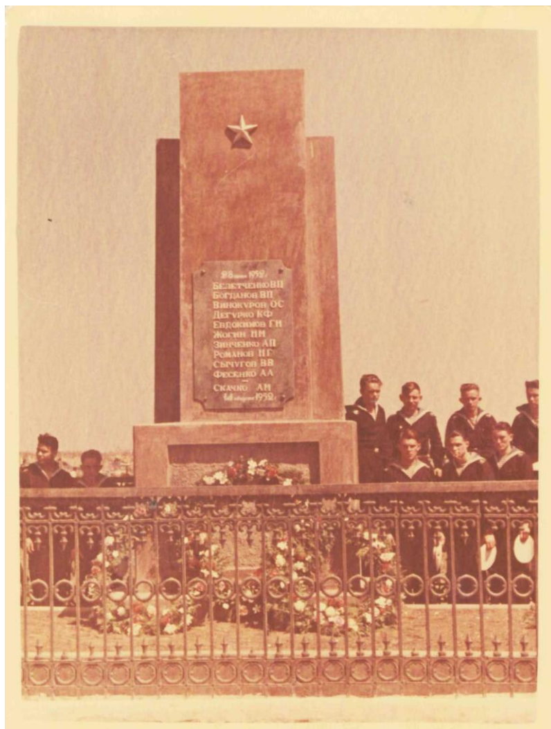
Памятник на старом кладбище, ныне снесённый. Ейск. 1956 г.