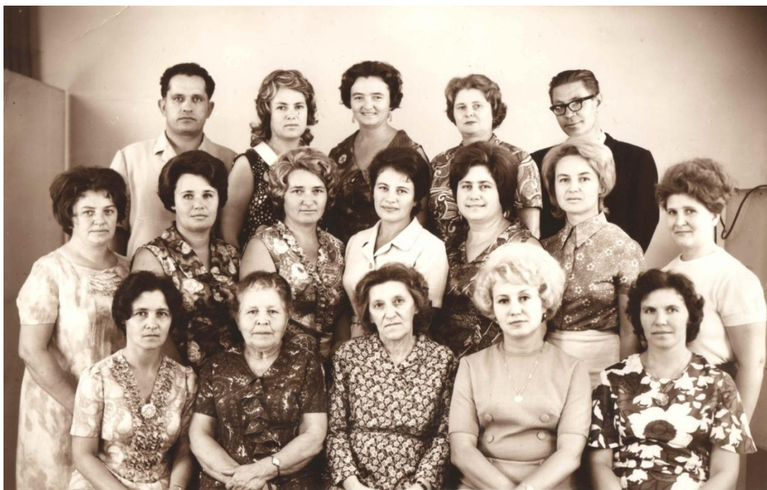
Выпускники 10 «А» и 10 «Б» классов 1953 г. СОШ № 4 "20 лет спустя..." Ейск, 5 августа 1973 г.

Мы просим об одном тебя, историк, Копаясь в уцелевших дневниках, Не умаляй ни радости, ни горя, Ведь ложь – она, как звезды в сапогах.