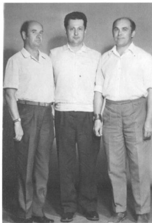
Они же 25 лет спустя.