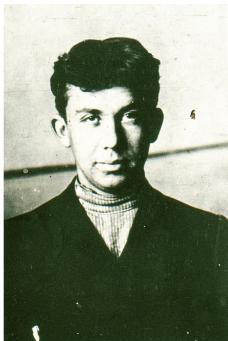
К.И. Шутко, начало XX в.